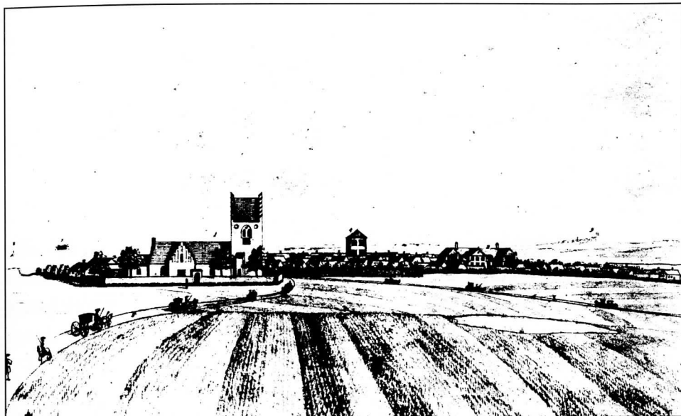
Gentoft 1753 (Johan Jacob Bruun). Øregaard Museum