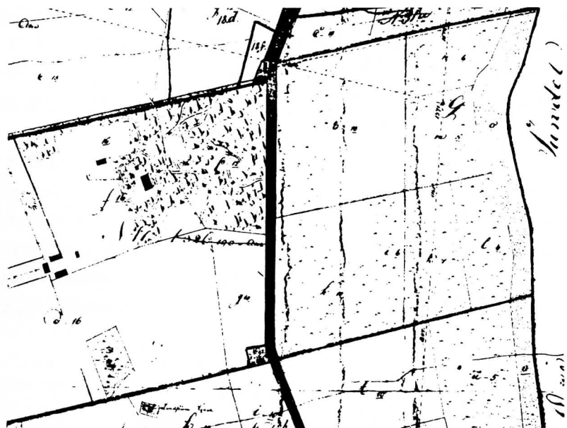
Den 11. september 1765 foregik lodtrækningen om bøndernes lodder ved udskiftningen. Det foregik på Bernstorff under stor spænding, for jordens bonitet var ikke ens, og alle var da heller ikke lige fornøjede, navnlig ikke dem, der fik lod på overdrevet. Deres lodder var i øvrigt større i udstrækning, så deres forhold blev nogenlunde ensartet Kort over Øregaard med omgivelser. Matrikelarkivet