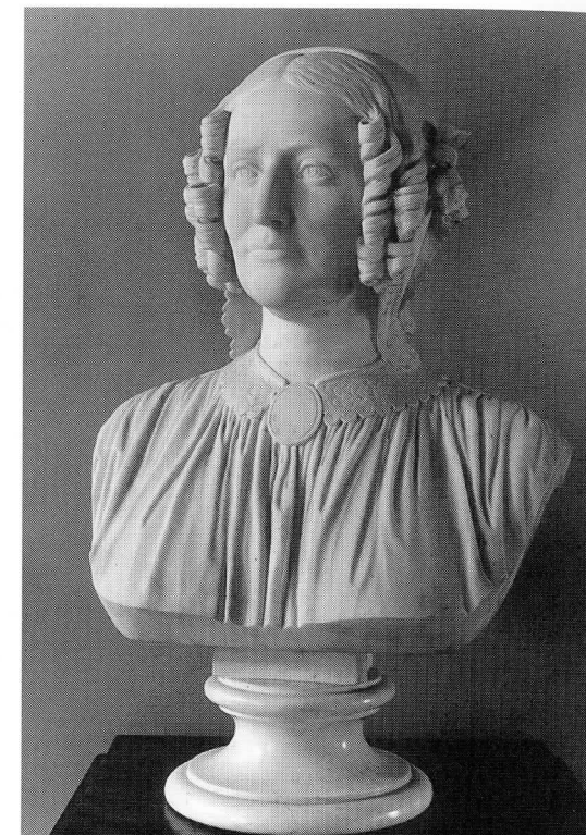
Buste af J. A. Jerichau Øregaard Museum