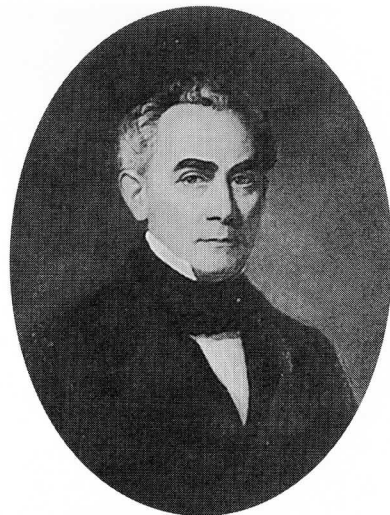
Maleri af C. A. Jensen 1838 Det Danske Handelskammer, Børsen