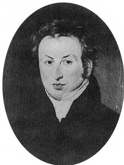
Maleri af C. A. Jensen 1830 Det Danske Handelskammer, Børsen